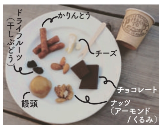
一口かじって一口飲んで、パートナー探し！

APLA が販売するコーヒーの中でのおすすめ例としては、香りや酸味が特徴のキリマンジャロには果物を使った食べものやチーズなどの乳製品。しっかりとした苦味やコクがあるルワンダにはガトーショコラやクッキーなどのバターやクリームを使ったスイーツ。甘みと良質の苦味があるラオスはお饅頭や大福などの和菓子と相性が良いのです！私は酸味が強いコーヒーが苦手でしたが、ドライフルーツを食べてからコーヒーを飲むと、お互いの酸味が高まり合って一気に口の中に甘みが広がり、苦手な味のコーヒーも美味しく飲めました！