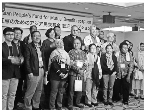
日本に集まった海外ゲストたち

APLA がサポートしている北部ルソンのしいたけプロジェクトに関しては、プロジェクトの失敗が確認されました。総融資額 75 万ペソのうち 4 万ペソの返済が完了。残りのローンの返済に関しては、CORDEV 理事会より 3～5 年の返済猶予期間の設置の要望があり、総会でこれが了解されました。猶予期間内にどのような形で返済を開始できるか、現地との協議を APLA がサポートすることになりました。