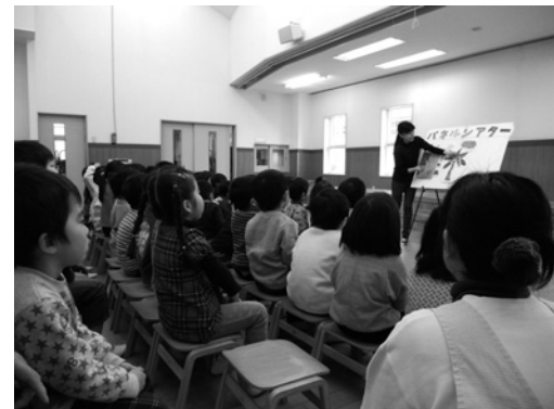
バナナの話を一息懸命聞く園児たち

緊急救援事業として始まったバナナ募金は2012年10月末で開始から1年が経過しました。2012年度は、単にバランゴンバナナを届けるだけでなく、送り先保育園・幼稚園と顔の見える関係をつくることをめざしてきました。その一環として、聖セシリア女子短期大学の先生と学生さんの協力のもと、保育園児でも分かるバナナの教材を製作。2013年1月、南相馬市にある原町聖愛保育園でバナナのワークショップを実施しました。素晴らしい教材のおかげで、子どもたちも先生も楽しみながら、バナナや生産者について学べた様子で、今後も継続していく予定です。