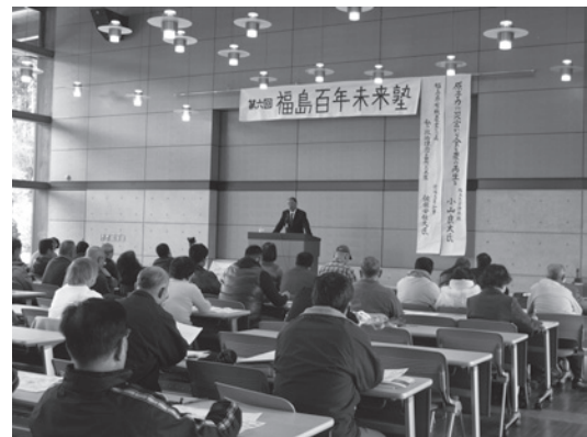
福島百年未来塾の様子 (第 6 回佐藤栄作さん講演)

※「福島百年未来塾」の振り返りと今後については、『APLA レポート No.6』をご覧ください。