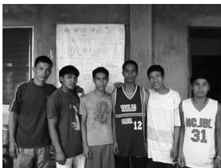
KF-RCの研修生たち (第3期生、第4期生)

注1/ATC：ネグロス島でマスコバド糖とバランゴンバナナの生産管理、輸出、生産者サポートを実施する事業体