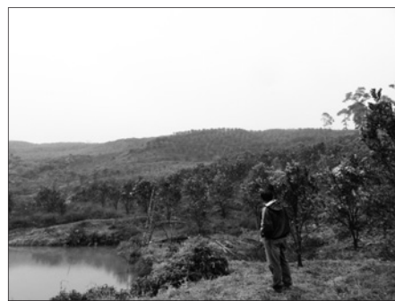
生物活性水を活用して実験をしている柑橘畑