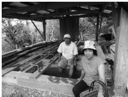
ギルパート農場に設置されたBMWプラント

注2/BMW 技術：バクテリア（微生物）・ミネラル（造岩鉱物）・ウォーター（水）の略。バクテリアとミネラルの動きをうまく利用し、土と水が生成される生態系のシステムを人工的に再現する技術のこと。