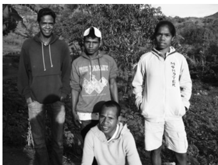
4 人の研修生たち。研修先のマヌファヒ県トゥリスカイにて。