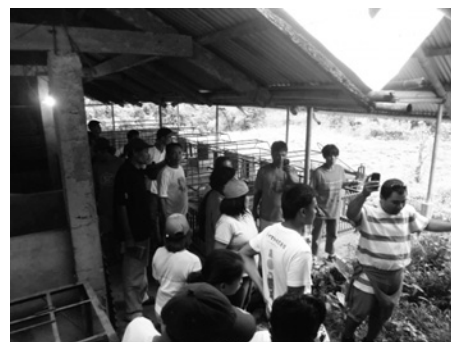
バナナ生産者たちがKF-RCを訪問