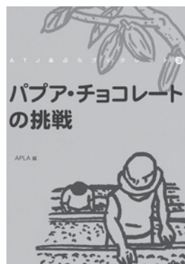
ブックレット表紙