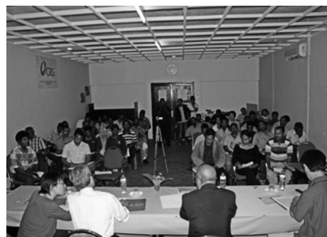
コーヒー生産者グループのリーダーを対象に開催したセミナーの様子。