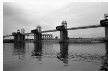
秋ヶ瀬取水堰 ここで取水された水は朝霞浄水場に送られ、品川区、千代田区、中央区など都心の上水として供給されている。(埼玉県志木市)