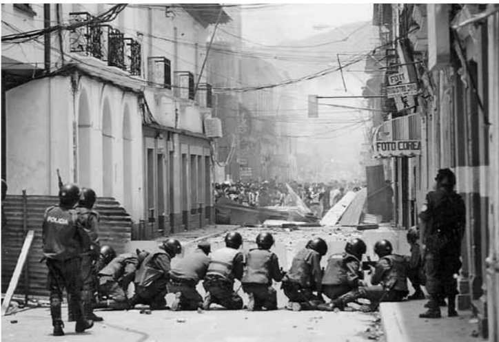
コチャバンバ水紛争(2000年)。