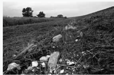
ペットボトルのゴミ 川の水位が下がったあと、流されてきたペットボトルなどのゴミが残される。(埼玉県志木市)

そんなドラマを持つ水と川を、都市生活の「合理性」が、本来の目的とは違ふかたちで使い尽くしている、そんな風景が荒川河川敷を歩いて見えてきました。風景はそこで暮らす人間を変えるといいます。私たち都市生活者はどう変わってきたのでしょうか。《写真撮影：2005年～2006年》