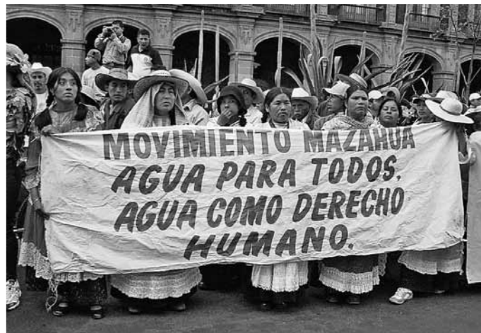
メキシコ水フォーラム(2006年)での抗議デモ「全ての人びとに水の権利を」。

水の商品化反対を合い言葉にグローバル規模に広がった「ウォーター・ジャスティス・ムーブメント」は、水問題を扱う国際舞台においてもその存在感を増している。