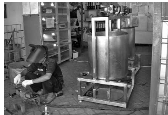
液体せっけん製造機械

の洗浄に自家製液体せっけんを使用する予定です。そもそもATINAでせっけん作りを始める動機は、地域の水質改善のために環境にやさしいせっけんの使用が必要だと考えたからです。インドネシアでは合成洗剤の使用が一般的で、エコシュリンプの産地シドアルジョヤグレスックでも人口増加による地元河川の汚染がエビの収穫量にも影響を及ぼすのではな