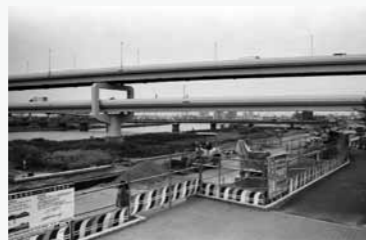
高速の橋 荒川をまたぐ首都高速道路。開通によって東北自動車道からスムーズに都心に入れるようになった。(東京都北区)