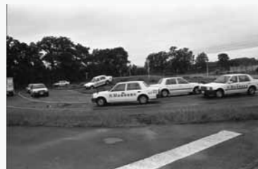
教習所の車 河川敷内のある自動車教習所。このあたりでは河川敷が数百mに及ぶ。(埼玉県川口市)