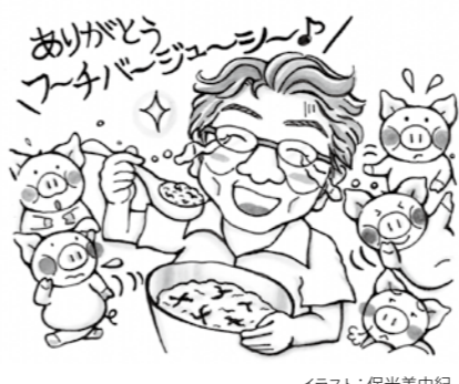
イラスト：保光美由紀