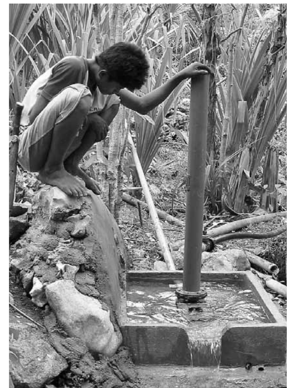
自動揚水器は、不思議な機械!

ダガスカルにも起きている。世界中には数百数千ヶ所この技術を待つ高地の住人たちがいる。様々な種類の揚水器の開発とリニューアル、社会的側面も考慮した準備、地元技術者の育成など、この総合的なAID財団の取り組みは、国内、国際的にも高く評価されている。アシュデン賞やエネルギーグロブ賞も授与された。これらに表彰されたことは、この自動揚水器の信用性を高め、技術をよりレベルアップすることにつながる。そして何より高台に住む最貧困地域の人びとを助けることができるのである。■