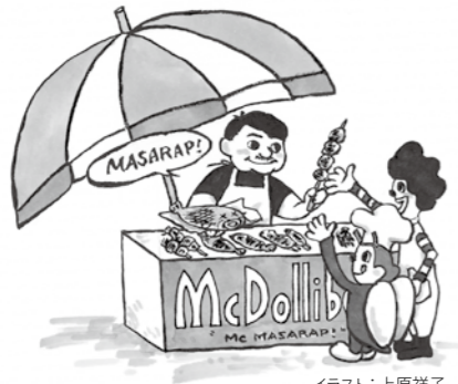
イラスト：上原祥子

フィリピンには競合する2大ファーストフード店がある。ひとつがマクドナルドで、もうひとつがジョリビー(Jollibee)。ジョリビーのメインはハンバーガーやフライドチキンだが、フィリピン人の食生活や舌に合わせたメニューも展開し、フィリピンにおいては世界を席巻するマクドナルドを唯一業界2番手に押し留めた。郷に入っては郷に従えとマクドナルドも手を打っているようだが、スパゲッティだってあるよと聞くと、フィリピンマックの苦戦のほどが窺い知れるような気がする。