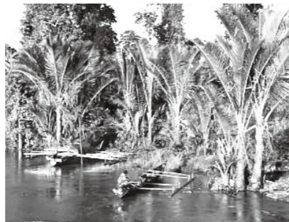
サゴヤシ、パプア・マンブラモ川流域。

うな道具でおが屑のように幹を掻き砕く。それを水に混ぜ袋の中でしごしご漉す。漉し出した濃い澱粉を含む水を葛湯のようにして、スープをかけて食べる。パプアではこれをパベタという。噛み出のない主食だが、やみつきになる。辛く、時には酸味の魚出汁スープとともにこれを食べることもたまたまない。家庭の主食だからレストランではあまり食べられない。もつとおもしろいヤシはピンロウ(檳榔)である。その実ピンロウ(檳榔、betel nut)をキンマという蔓植物の葉ないし房、そして石灰と噛み合わせる口が真っ赤になり気分が何ともハイになる。飲み込んではいけない。ほとんど麻薬のようだ。この話をもっと書きたいが紙数が尽きたのでオシマイです。