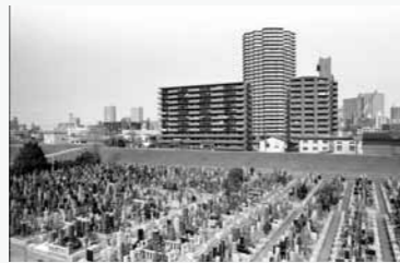
マンションと墓 堤防の幅を広げたためお寺は堤防上に移動し墓は堤防の間に残された。(埼玉県川口市)