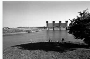
岩淵水門と釣り人 河口から22キロ地点にある旧岩淵水門(1924年完成)ここから先は洪水を防ぐために掘られた幅500mの人工の河川となる。(東京都北区)