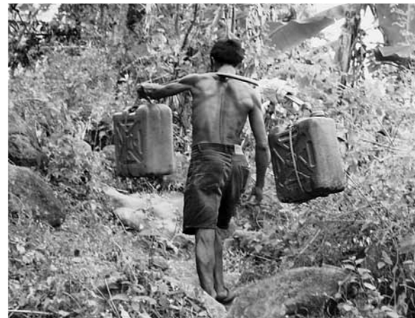
自動揚水器設置前の水汲み。