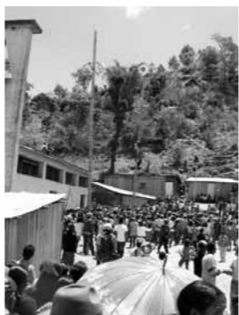
ある町での住民投票10周年記念イベント「木登り競争」。上に賞品がぶらさげられてあり、早い者勝ちで到達してゲットする。

そしてそのとき、歴史は確かにつくられた。40数万人の一票一票によって。それまで独立運動の先頭に立ってきた指導者の一票も、17才になったばかりの若者の一票も、文字を読めない山村の老人の一票も、それが一票であるということにおいては平等だった。人びとは等しく一票を投じることで歴史に参加した。私はその一票一票を数えながら（開票スタッフだったので）そのことを実感した。